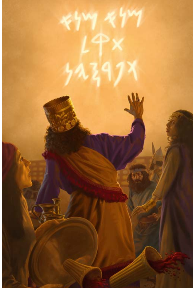
Иегова отнял царство у Валтасара и отдал мидянам и персам (Смотрите абзац 12.)

12. Приведите примеры, как Иегова свергал царей. (Смотрите иллюстрацию.)